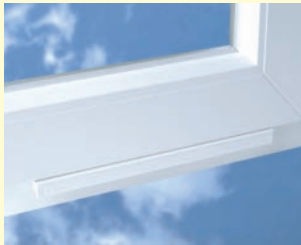
REGEL-air® ÜL für Kunststoff-Fenster