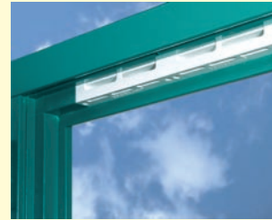
REGEL-air® H für Holzfenster