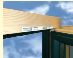
REGEL-air® H/A für Holz-Alu-Fenster

REGEL-air® Fensterlüfter - eine Entwicklung und Produkt der REGEL-air Becks GmbH & Co. KG www.regel-air-fensterluefter.de