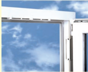
REGEL-air® K für Kunststoff-Fenster